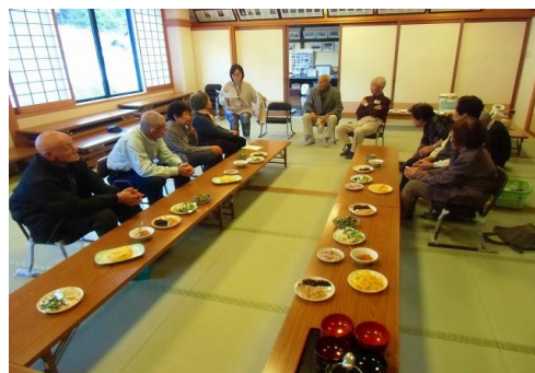
サロン風景の一コマ