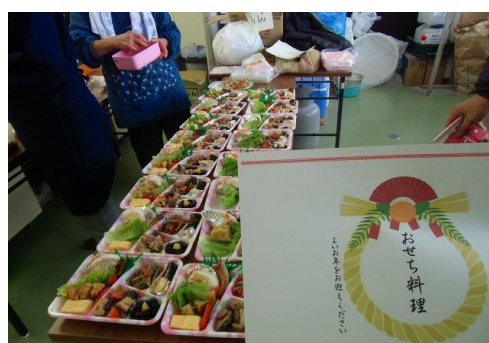
手作り「おせち料理」