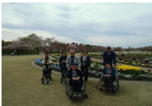
サロンで中央植物園を訪問